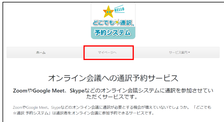
マイページをクリック

サービスの新規予約申込確認、会議室のURL連絡などはマイページ内で行います。 「マイページへ」をクリックしてログインしてください。 ID・パスワードは別途送付させていただいている通知書をご確認ください。