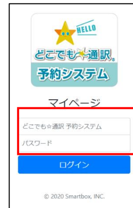
ID・パスワード入力し ログイン